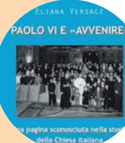
Una pagina sconosciuta nella storia della Chiesa italiana