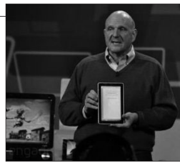
IL RIVALE Lo Slate di Hp con Microsoft

Ad inventare il primo tablet, il «Dynabook», era stato nel 1968 Alan Kay, un ingegnere che lavorava in un laboratorio delle innovazioni nella Silicon Valley. Lo stesso Steve Jobs, intorno al 1983, aveva disegnato «Bashful», una specie di voluminoso tablet, mentre, nel 2002, anche Bill Gates aveva lanciato la sua idea di un pc portatile con un schermo mobile e touch.