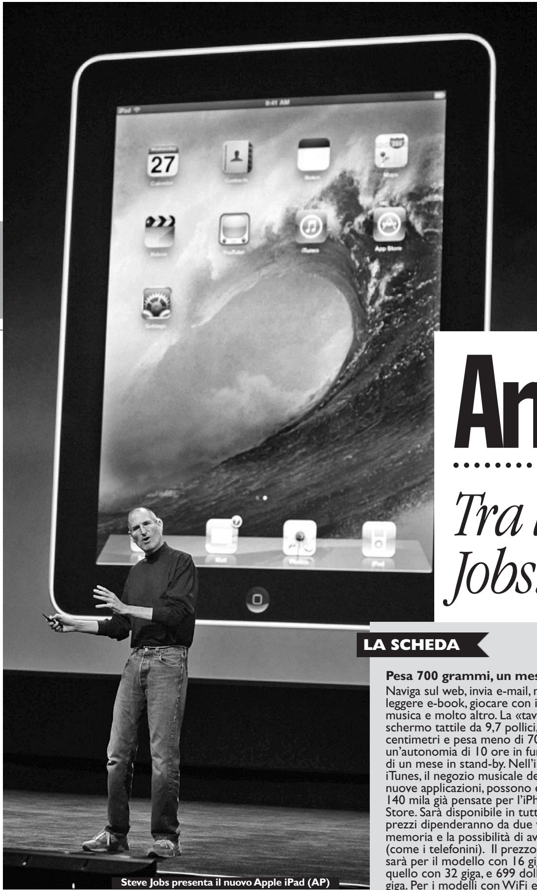
Steve Jobs presenta il nuovo Apple iPad

Attesissima, ecco la nuova «magica» creatura della Apple. Una tavoletta da 9,7 pollici senza tastiera. Servirà per leggere libri e giornali, giocare, navigare, guardare video, telefonare. Prezzo: da 499 a 829 dollari. Svolta o super-gadget?