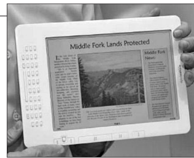
IL PRESENTE Amazon Kindle si rinnova

Hp, ha appena annunciato «MusicStation», una piattaforma per scaricare musica digitale a pagamento che dovrebbe sbarcare anche in Italia e, appena due giorni fa, ha svelato con uno speciale filmato su YouTube lo «Slate», il tablet Pc annunciato all'inizio dell'anno a Las Vegas insieme al numero uno di Microsoft, Steve Ballmer.