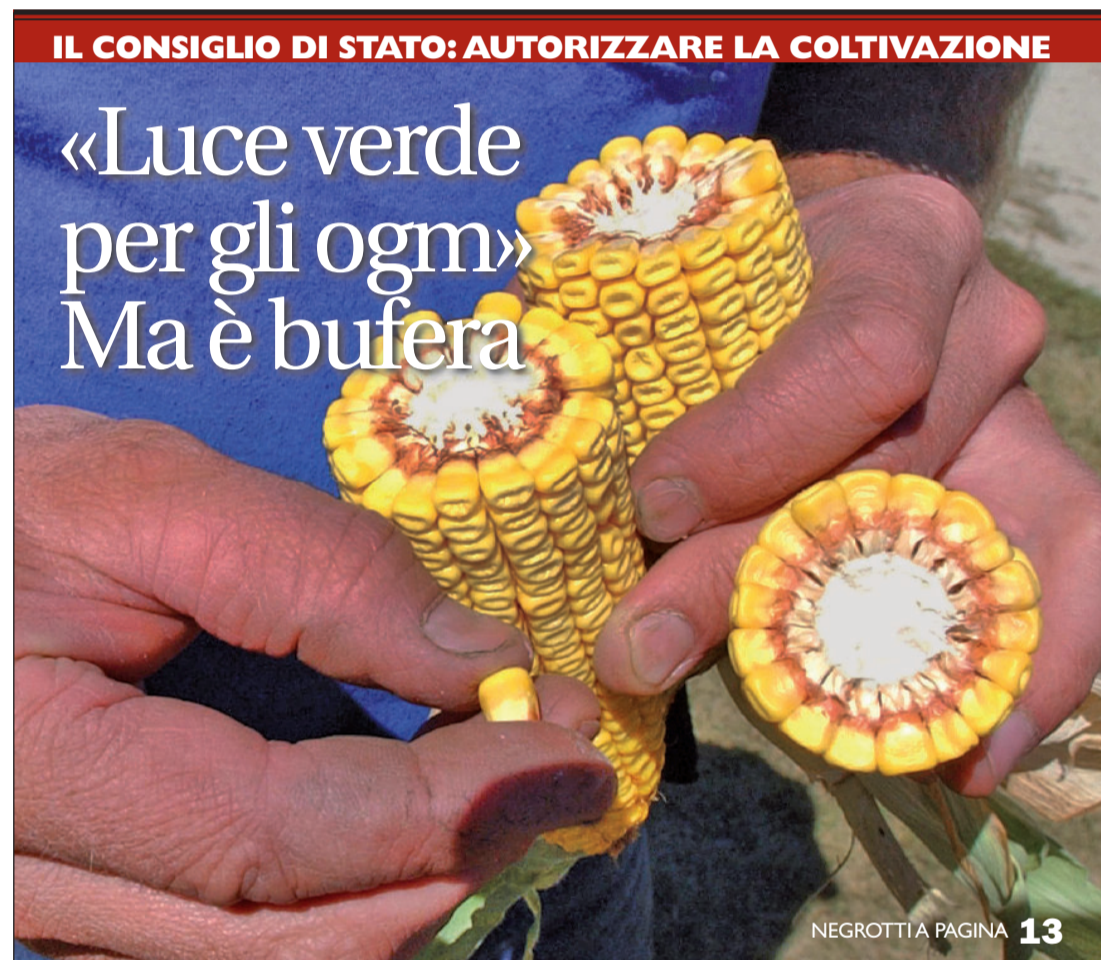
NEGROTTA PAGINA 13